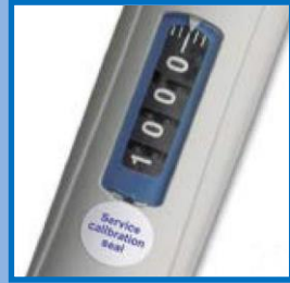
視認性に優れた大型目盛