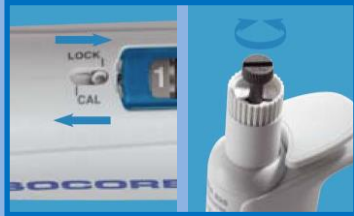
ユーザーキャリブレーション 分注容量の微調整も簡単操作