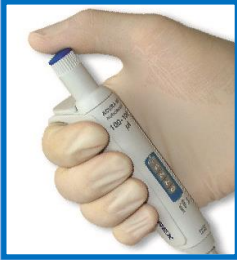
操作性に優れたデザイン